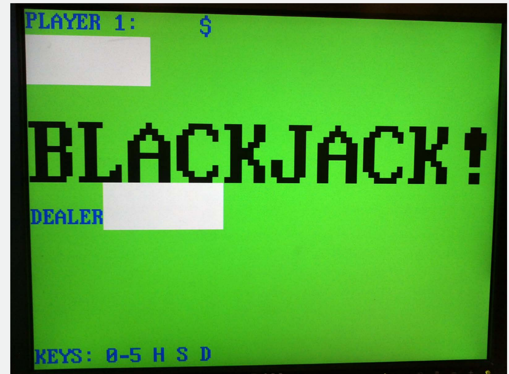
Billedet viser det færdige spil